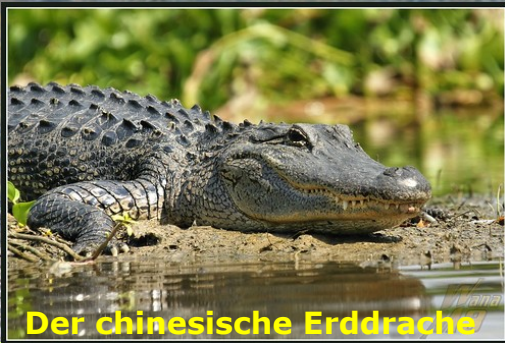
Der chinesische Erddrache

Im Zentrum steht der chinesische Erddrache, nationales Glückssymbol in China. Dazu kämen weitere asiatische Tiere und Pflanzen. Der Bau sollte viel Licht erhalten, also eine Glaskuppel, und ein großes Außengelände mit Teich, denn der 2 Meter lange Drache liebt Wasser und Wärme, weswegen er in den Wintermonaten in eine Art Winterschlaf fällt. Zoodirektor Nor-