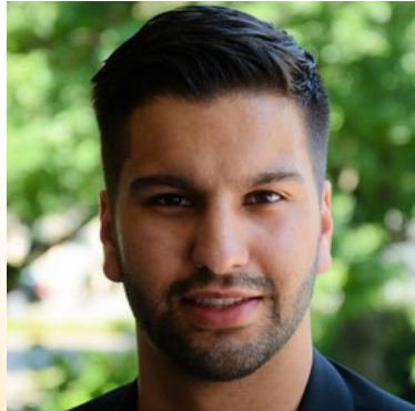
Damhat Sisamci, MdL arbeitsmarktpolitischer Sprecher der SPD-Fraktion im Landtag des Saarlandes

Wie jedes Jahr traf sich der Vorstand des SPD-Ortsvereins Neunkirchen-Zoo zur Jahresklausur, um Themen und Veranstaltungen zu planen. Da im Robinsondorf ukrainische Flüchtlinge untergebracht sind, musste ein neuer Ort gefunden werden. Mit dem Vereinsheim der Tennisabteilung des TuS Neunkirchen wurde eine sehr ansprechende Alternative gefunden. Gast war Damhat Sisamci, seit der letzten Wahl Mitglied des Landtages. Er verwies auf wichtige Entscheidungen der SPD im Land und im Bund, wie die Erhöhung des Mindestlohnes auf 12 €, wovon allein im Saarland 20.000 Menschen betroffen sind. Auch werden fortan öffentliche Aufträge nur noch an Firmen vergeben, die ihre Beschäftigten nach Tarif bezahlen. Mit einem 3-Mrd-Euro-Fond wird die saarländische Regierung in den nächsten 10 Jahren den ökologischen Umbau voranbringen. Neben dem bundesweiten 49-Euro-Ticket wird es im Saarland ein 365-Euro-Jahresticket (30,40 € pro Monat) für Schülerinnen und Schüler, Auszubildende und Freiwilligendienstleistende geben. Und 2023 wird wieder der volle 5-Tage-Bildungsurlaub für alle Beschäftigten eingeführt. Damhat Sisamci stellte zusammenfassend fest: „Die SPD ist die einzige Partei, die die Interessen der ganz überwiegenden Mehrheit der Bevölkerung vertritt.“