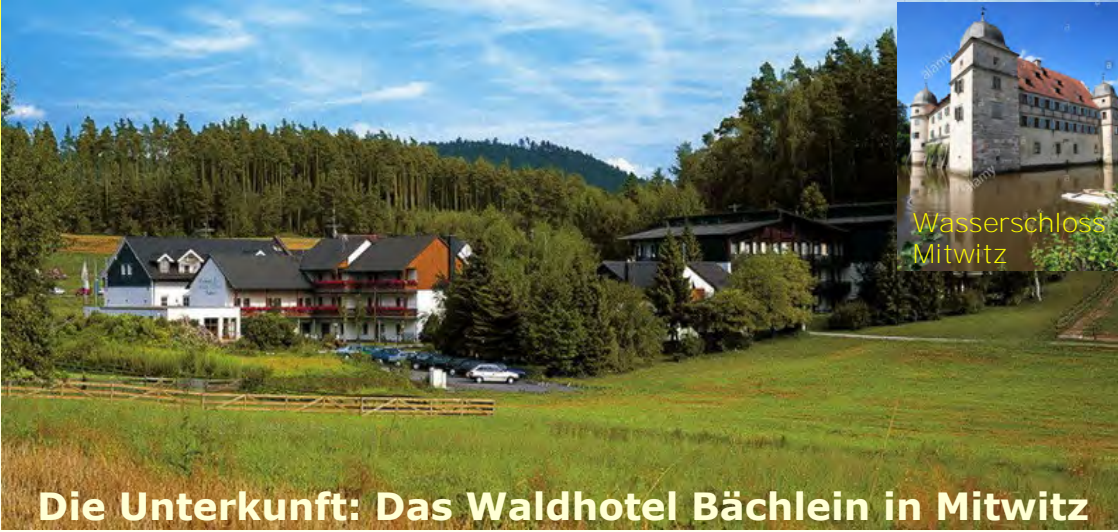
Die Unterkunft: Das Waldhotel Bächlein in Mitwitz