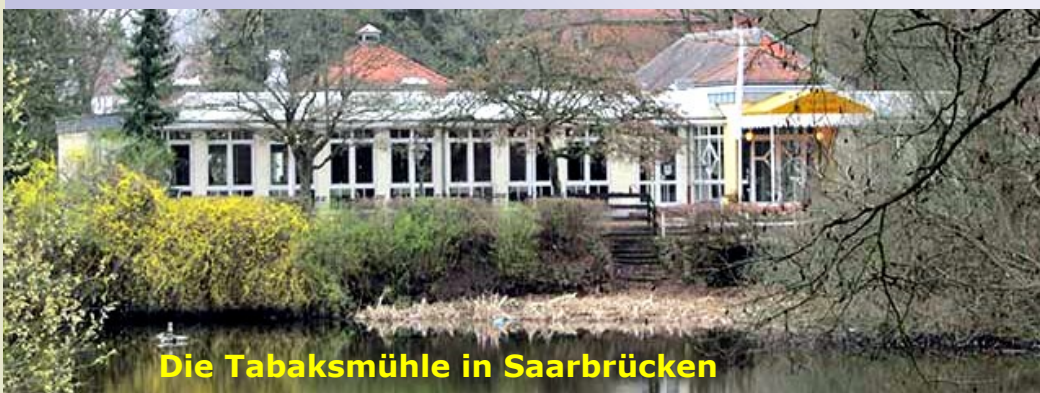
Die Tabaksmühle in Saarbrücken