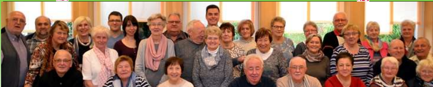
Der Ortsverein boomt. Mit derzeit 103 Mitgliedern zählen wir mittlerweile zu den Großen der 11 Neunkircher Ortsvereine. Und noch eins: Frauen bilden bei uns die Mehrheit. Das ist selten in Parteien! Hier das Bild unseres Vorstands.