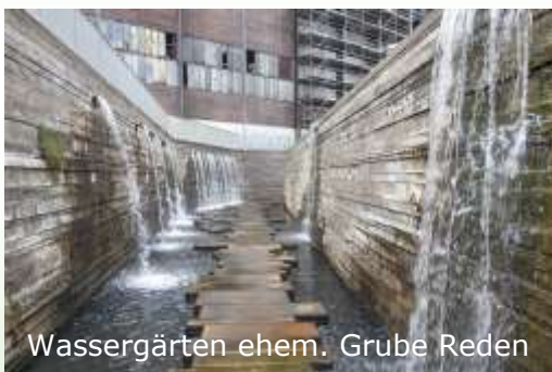
Wassergärten ehem. Grube Reden

Der Kohlekonzern RAG beantragte die Hebung des Grubenwassers im Saarland auf -320 Meter. Warum? Das Pumpen ist richtig teuer. Laut RAG sei eine Grubenwasserhebung auf diesem Niveau ungefährlich. Belege dafür gibt es zahl-