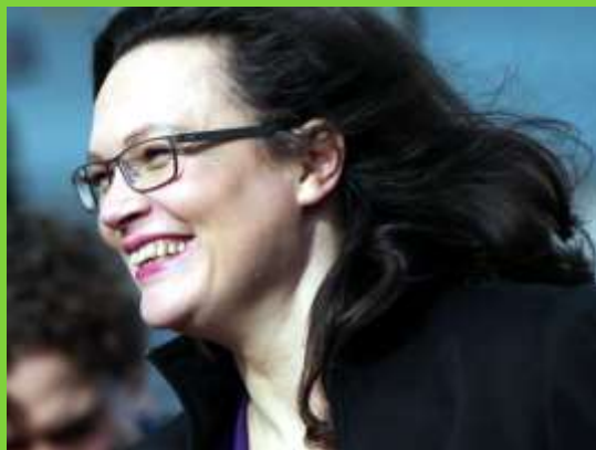
Andrea Nahles soll neue SPD-Bundesvorsitzende werden— Übrigens die erste in der 155-jährigen Geschichte der Partei.

Der Koalitionsvertrag trägt die Handschrift der SPD: Viele Verbesserungen für die Menschen, allerdings auch keine großen Würfe. Steuerreform zu Lasten der Reichen, Bürgerversicherung u.a. Strukturformen sind mit der CDU/CSU nicht zu machen. Die SPD stellt allerdings die wichtigsten Ministerien, sieht man von Bildung und Innen ab. Die Kanzlerin bleibt vorerst und das Saarland regiert überproportional mit. Leider hat das unseren klammen Kommunen bislang wenig geholfen. Gleiche Lebensverhältnisse gibt es in Deutschland nicht: In Sachsen, Bayern, Baden-Württemberg und anderswo können Kommunen ein Vielfaches von dem in die Infrastruktur investieren als im Saarland. Das muss sich ändern!