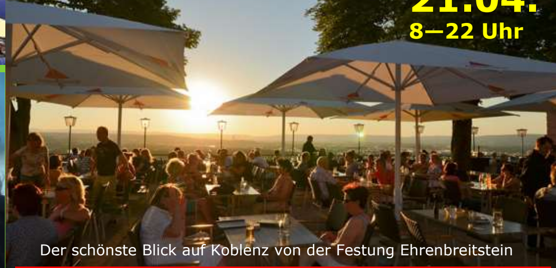
Der schönste Blick auf Koblenz von der Festung Ehrenbreitstein

Frühstück / mit der Seilbahn zur Feste Ehrenbreitstein mit Führung / große Burgen-Schiffsrundfahrt / Abend im Zummethof an der Mosel / komfortabler Reisebus. Teilnahmebeitrag: 40 € Mitglieder/ 45 € Nichtmitglieder