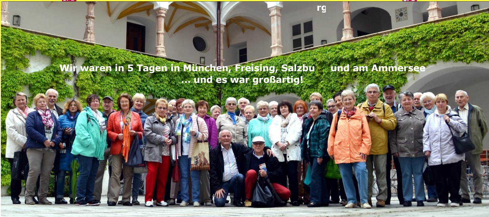
Wir waren in 5 Tagen in München, Freising, Salzburg und am Ammersee ... und es war großartig!

Die mehrtägigen Jahresfahrten des SPD Ortsvereins sind schon legendär. Dieses Mal ging es mit 41 Personen nach München. Anfangs wieder im Regen, wie bei der letzten München-Fahrt 2010. Echt mühsam war auch die Plackerei mit dem Gepäck, das in Freising den Domberg hinaufgeschleppt werden musste; denn wir waren in der Heimstätte des Papstes Benedikt untergebracht. Da ging's richtig bergauf, dann aber auch mit dem Wetter. Olympiastadion, BMW-Welt, Deutsches Museum, Burgfest Salzburg, Englischer Garten in München, Kloster Andechs, Schifffahrt auf dem Ammersee und vieles mehr bei meistens bestem Wetter; gutes Essen und Trinken inklusive. Nur kurz vor Ende der Fahrt gab es eine derbe Überraschung: 30 km vor Neunkirchen blieb der Bus stehen. Nichts ging mehr. Das nächste Mal nehmen wir wieder einen Bus aus der Heimat! Über die Fahrt gibt es erstmals einen 48-seitigen Bildband.