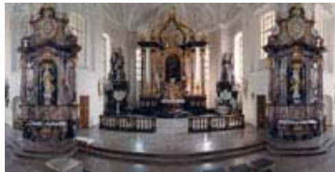
Die barocke Peterskirche von Balthasar Neumann.

Zu einem so wunderschönen Schloss gehört natürlich auch eine ebenso wunderschöne Parkanlage.