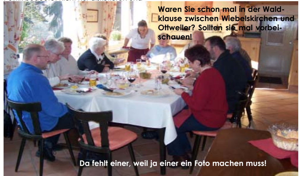
Da fehlt einer, weil ja einer ein Foto machen muss!

Waren Sie schon mal in der Waldklausur zwischen Wiebelskirchen und Ottweiler? Sollten sie mal vorbeischauen!