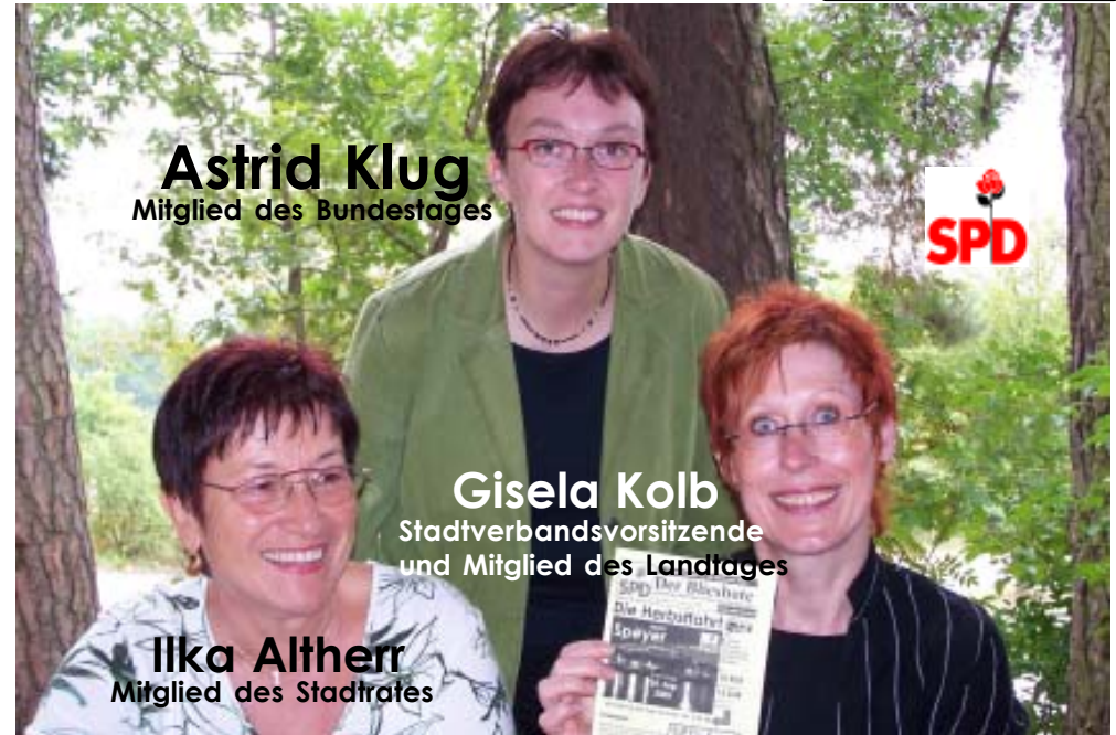
Astrid Klug Mitglied des Bundestages