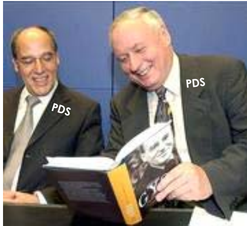
Sie haben immer gut lachen: Wenns ans Umsetzen geht, machen sie sich aus dem Staub!

Was hat Bundespräsident Köhler in seiner letzten Fernseh-Ansprache gesagt? Wir sollen von unserem Wahl-