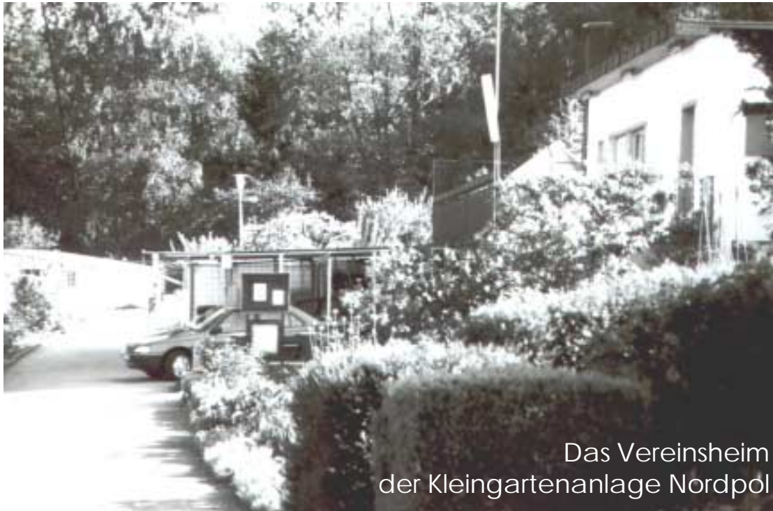
Das Vereinsheim der Kleingartenanlage Nordpol

Ein herzliches Dankeschön ergeht an all unsere Helfer beim diesjährigen Stadtfest.