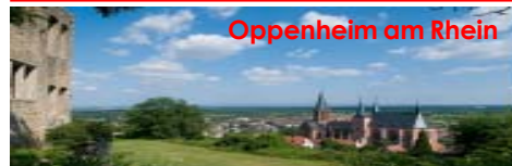
Oppenheim am Rhein

Wir laden ein zum SPD-Ortsvereins-Treffen am Dienstag, dem 1. März und 5. April 19.00 Uhr, ins Naturfreundehaus