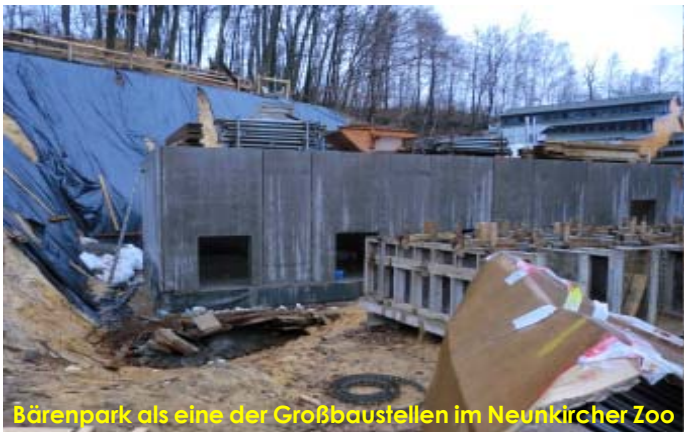
Bärenpark als eine der Großbaustellen im Neunkircher Zoo

ten. Daran anschließend befindet sich das neue Maritimum, ein mit küstentypischer Vegetation bepflanzter Felsengarten und eine Felsentribüne, von der aus es Groß und Klein Spaß macht, die See- hunde bei den zweimal täglich außer donnerstags stattfindenden Fütterungen zu beobachten. Ergänzt durch einen neuen Ausgangsbereich, der sich daran anschließt. Und es