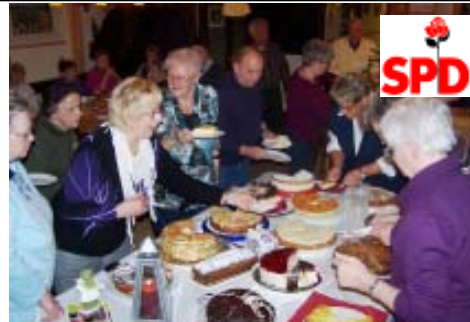
Die SPD-Frauen laden für Dienstag, den 8. März 2011, 20 Uhr zu ihrem Treffen ins Naturfreundehaus

Wir laden ein zum SPD-Ortsvereins-Treffen am Dienstag, dem 1. März und 5. April 19.00 Uhr, ins Naturfreundehaus