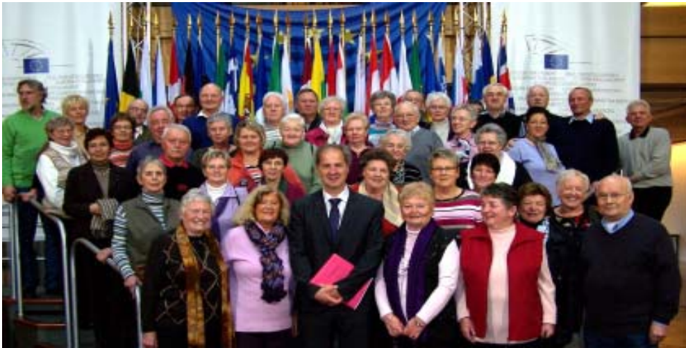
Am 20. Januar waren wir zu Gast bei Jo Leinen, MdEP, (Bildmitte) im Europa-Parlament in Straßburg. Jo Leinen sagte uns einen Besuch des Neunkircher Zoo zu. Natürlich werden wir dies gebühlich zu feiern wissen.