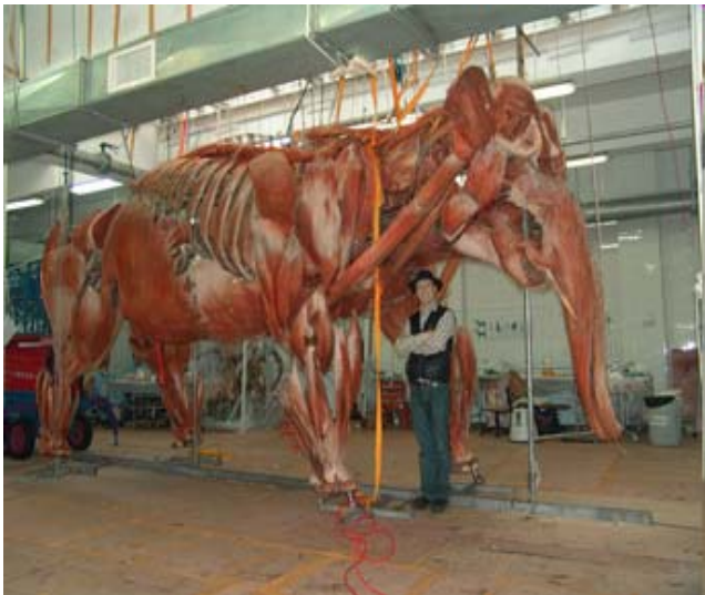
Elefantendame Samba als Plastinat, daneben Gunther von Hagens.

Sozusagen gleich vier Elefanten-Damen werden ab 19. März 2010 im Neunkircher Zoo neu zu bewundern sein. Doch während die einen im besten Elefanten-Alter und rassige Spanierinnen aus Benidorm sind, die voraussichtlich im Februar zur altersschwachen Judy und zu Kirsty ins Elefantenhaus ziehen, sind die anderen beiden in Neunkirchen wohl bekannt und trotzdem nicht mehr wieder zu erkennen. Samba und Chiana, den Neunkircher Zoo-Besuchern bestens in Erinnerung, werden als Plastinate in ihre Heimat zurückkehren.