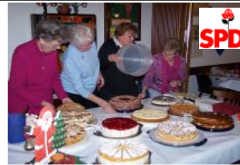
Die SPD-Frauen laden für Dienstag, den 10. Februar 2009, 20 Uhr zu ihrem Treffen ins Naturfreundehaus

Wir laden ein zum SPD-Ortsvereins-Treffen am Dienstag, dem 3. März 2009, 19.00 Uhr , ins "Fass", Wellesweilerstraße.