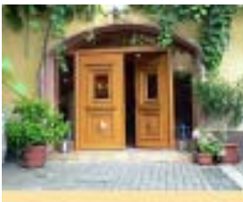
Das Weingut Mayerhof bei Grünstadt

Wer will, bekommt die angebotenen Weine beschrieben.