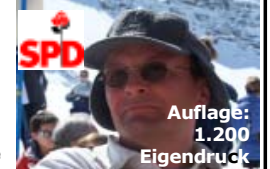
Auflage: 1.200 Eigendruck