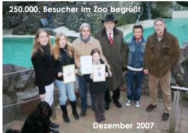
250.000. Besucher im Zoo begrüßt