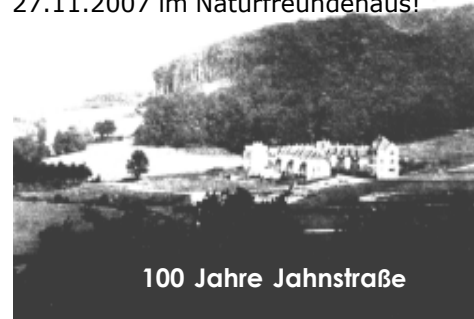
100 Jahre Jahnstraße

Zur Straßenbahngeschichte erschien daher ein wunderschönes reich bebildertes Buch (19,90 EUR). Über unseren Ortsbereich dagegen wurde ein Film von Hans-Günther Ludwig und Werner Fried gedreht, der bis zu den Ursprüngen 1716 zurückreicht. Welturaufführung ist am 27.11.2007 im Naturfreundehaus!